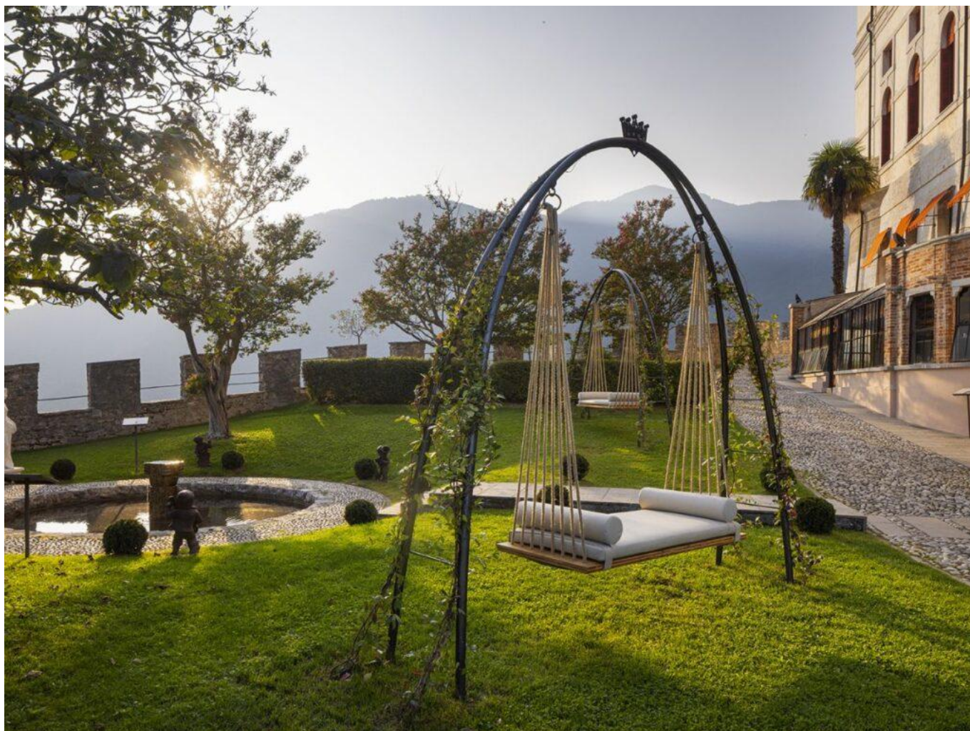
Gli spazi esterni di CastelBrando.

All'interno del maniero, nelle aree archeologiche, sono stati ricavati 2.000 metri quadrati, per realizzare un luogo dedicato al benessere . La metà di questi sono interni e climatizzati, e l'altra metà esterni, rispettivamente nei giardini dell'Eden e nel terrazzo botanico del XVI secolo .