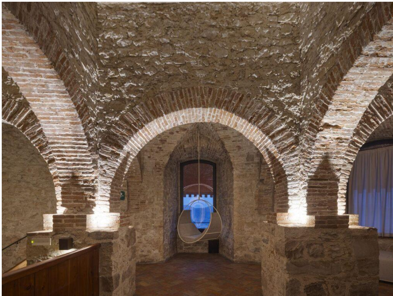
La Princess spa, ricavata dagli antichi Bagni Romani.