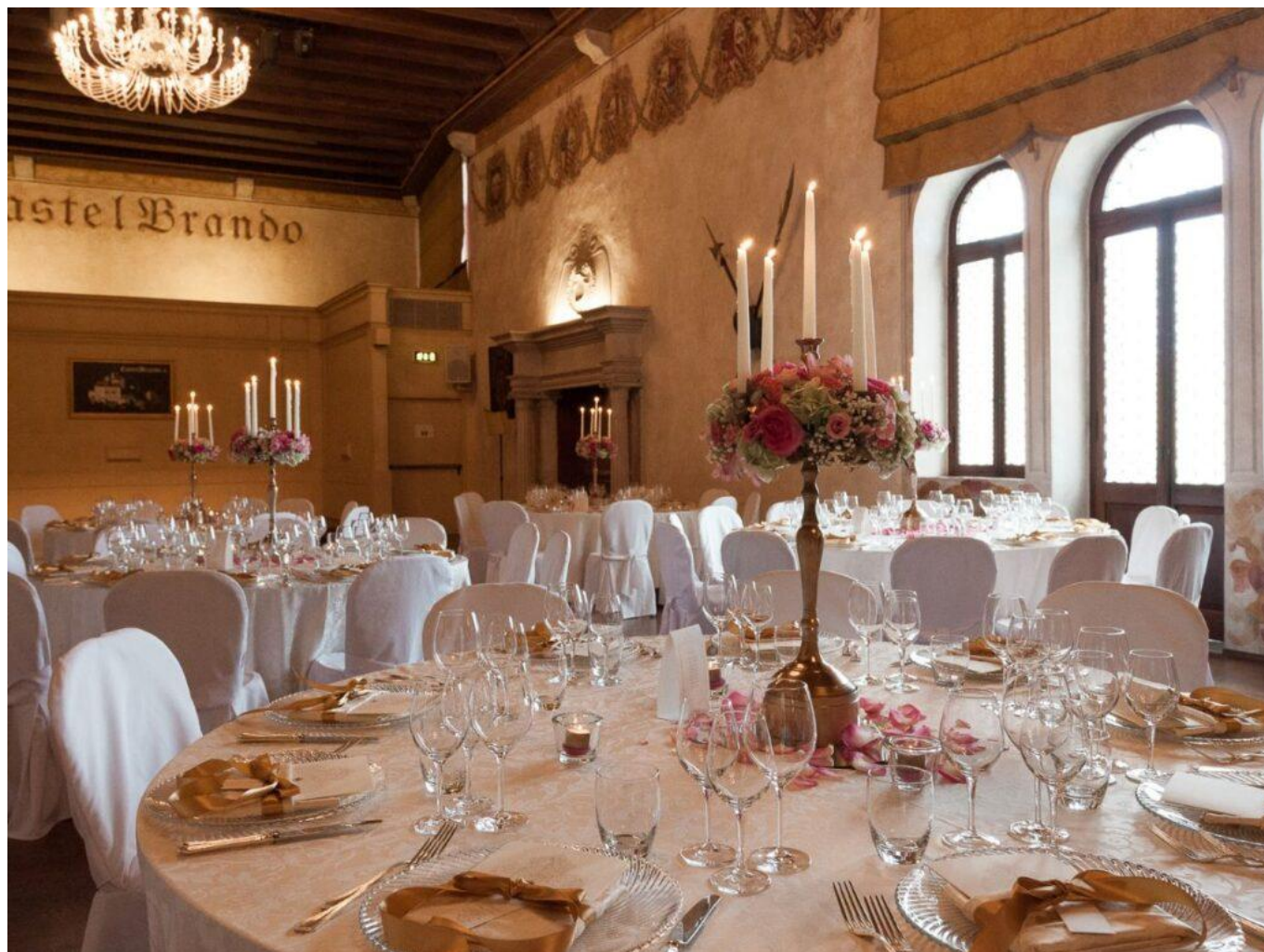
Il Sansovino, uno dei due ristoranti dell'Hotel.

Una curiosità: nel 1933 il Conte Senatore Gerolamo Brandolini , allora proprietario di Castel Brando, depositò a Roma la registrazione del mascarpone realizzato nella sua latteria a Cison di Valmarino, ingrediente principale del Tiramisù, e ne divenne il maggior esportatore in Europa.