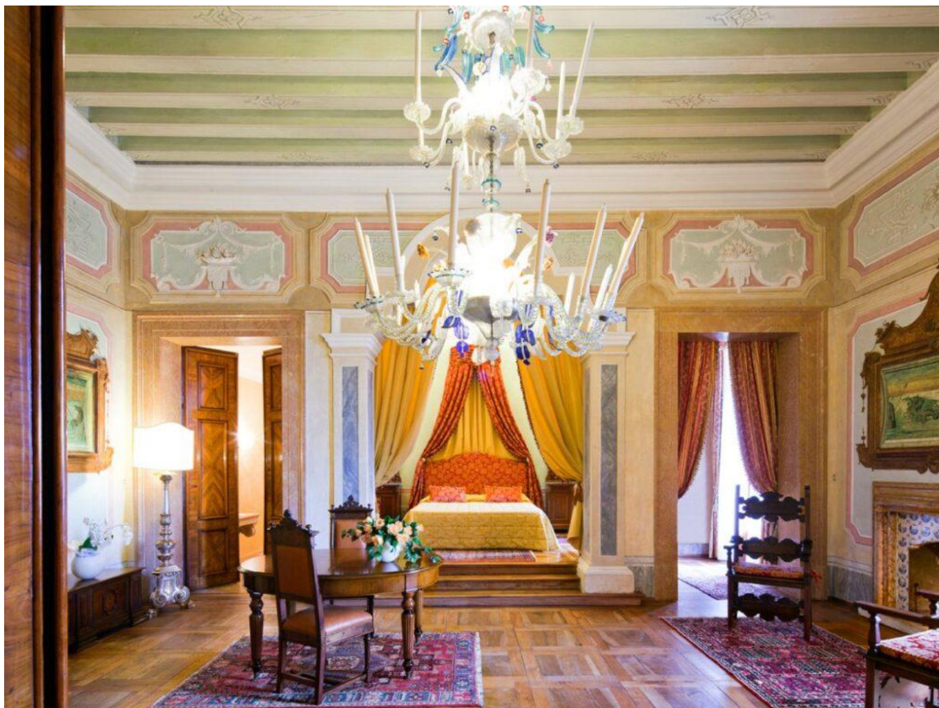
L'Alcova del Conte, alloggio dei Conti Brandolini.