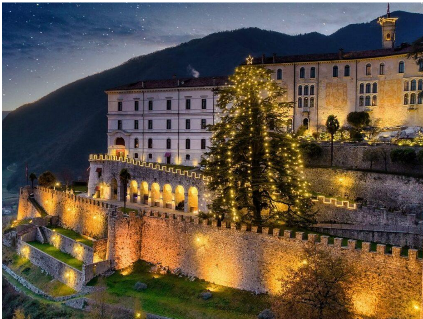
L'albero di Natale alto 33 metri.