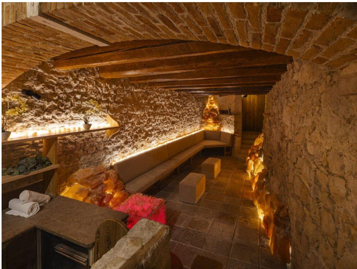
La suggestiva spa interna.