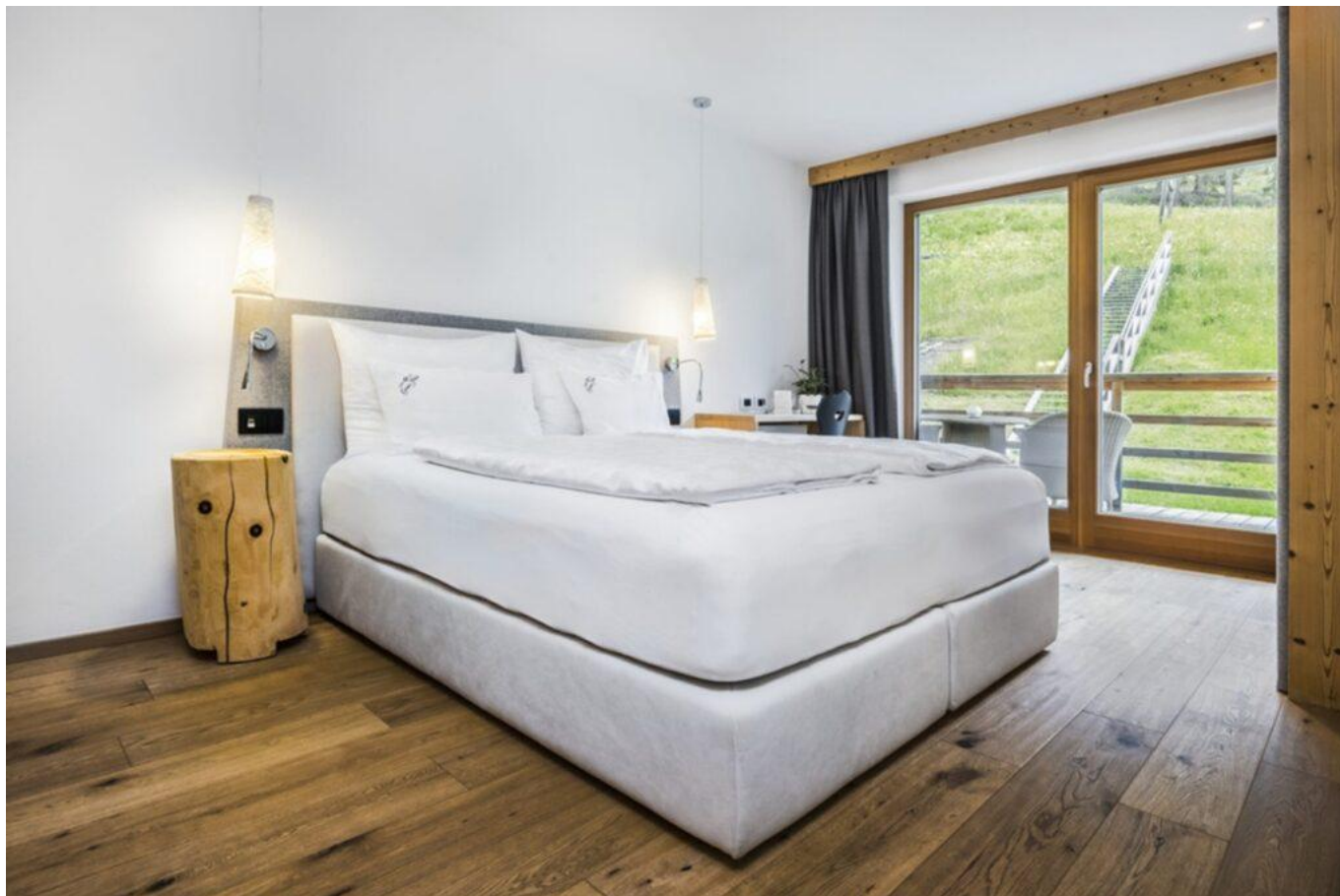
Una delle camere dell'Hotel (Foto © Hotel Gran Fodà).

Confortevoli anche gli spazi comuni, con divani ricoperti di morbidi cuscini e zuppiere colme di gustose mele.