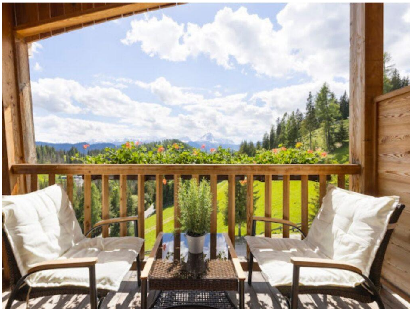
La Casa è certificata Klimahaus.

Il protocollo CasaClima non si limita solo all'efficienza energetica, ma valuta anche il comfort abitativo, la qualità costruttiva e l'uso di materiali ecologici, promuovendo un approccio complessivo alla sostenibilità.