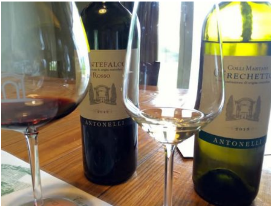
Montefalco rosso e Grechetto.

Partiamo con il Grechetto dei Colli Martani 2015 (14%). Una doc in purezza che non si smentisce presentandosi in tutta la sua freschezza e la sua potenzialità estiva di bevibilità. Una struttura presente si equilibra perfettamente con la sapidità del finale, amalgamandosi in una complessità educata e fine. Esplosione al palato agrumi, mandorla e fiori. Abbinamenti consigliati sono il mare, soprattutto antipasti, formaggi freschi e salumi della tradizione.