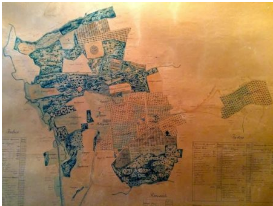
La Tenuta Antonelli.

L'azienda (175 ettari di cui 50 a vigneto, i restanti si dividono tra ulivo, seminativo, bosco) produce diverse tipologie in bottiglia. Due i bianchi ( Grechetto Colli Martani e Trebbiano spoletino ) e sette i rossi ( Baiocco , Montefalco rosso , Montefalco Rosso riserva , Contrario , Montefalco Sagrantino , Chiusa di Pannone e Montefalco Sagrantino passito ). A questi si aggiungono grappe (Sagrantino) e un eccellente olio extravergine di oliva .