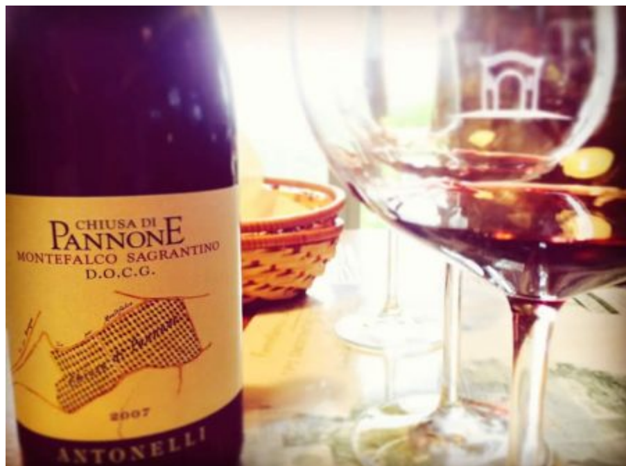
Montefalco Sagrantino D.O.C.G.

Poi arriva il Montefalco Sagrantino 2010 (15°), il vino tradizionale del territorio in cui la grande struttura fa rima con longevità. Grazie all'affinamento (rovere da 500 litri, botti di rovere da 25 hl, vasca di cemento e poi in bottiglia) il dialogo che intraprende con il bicchiere è chiaro, netto e preciso. Il suo rosso rubino intenso anticipa la percezione, confermata, di un olfatto potente e complesso. Al palato risulta molto strutturato, con tannini identitari e persistenti. Un vino che bussa alla porta dei vini classici, riuscendovi. Si sposa perfettamente con grigliate, arrostiti importanti, cacciagione, stufati e brasati e con formaggi stagionati.