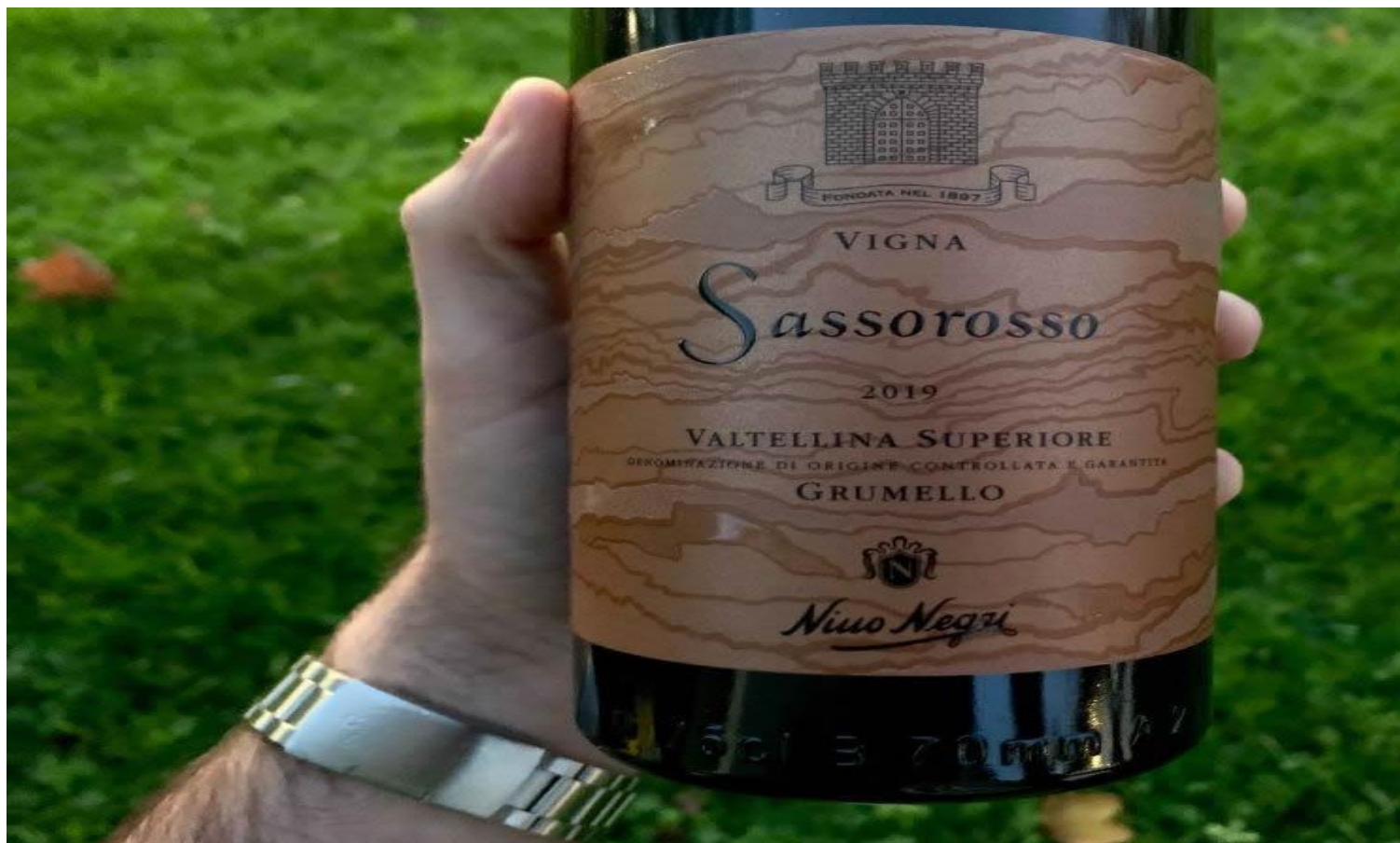
Valtellina Superiore "Vigna Sassorosso" DOCG 2019 (Foto © Kevin Feragotto).