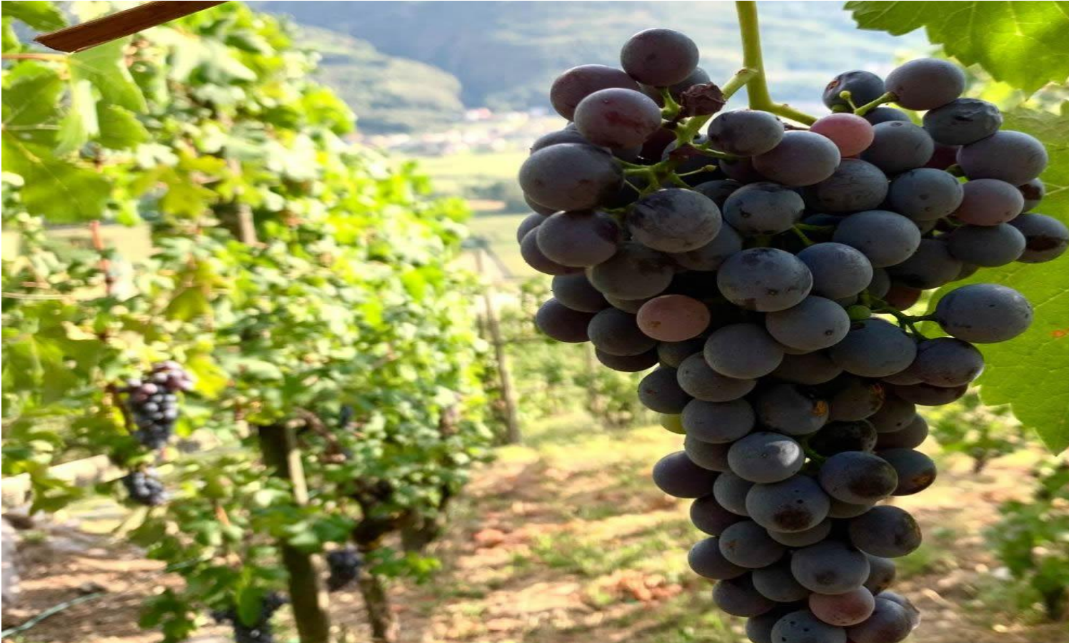
Un grappolo di Chiavennasca o Nebbiolo delle Alpi.

È raro avvertire il silenzio in una regione frenetica come la Lombardia, adeguatasi alle richieste del “tempo industriale” che, spesso, nei ritmi naturali vede un limite alla profittabilità. Eppure, in tutto questo trambusto, c'è un luogo dove i minuti, le ore e i giorni scorrono ancora lentamente, in un quieto presente: la Valtellina .