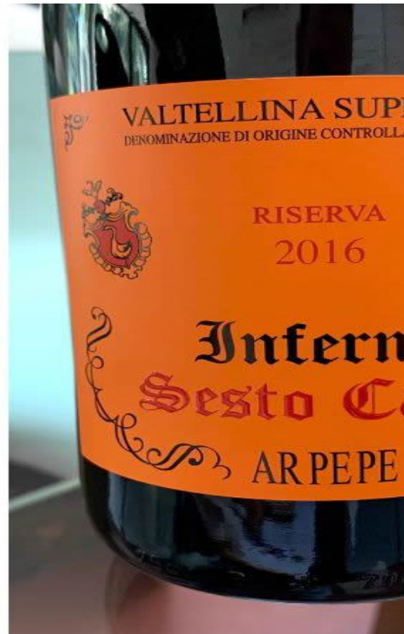
Due etichette Arpepe.

Non meno interessante è il Valtellina Superiore Sassella Riserva “Ultimi Raggi” DOCG 2016 , la cui prima annata risale al 1999 – gli ultimi raggi del secolo, appunto. Un vino ottenuto a partire da uve surmature, raccolte nel mese di Novembre in zona Sassella a 600 metri d’altitudine. A questo punto dell’anno, le viti hanno già perso parte del proprio fogliame mentre gli acini presentano una buccia ispessita e una polpa particolarmente zuccherina, grazie alla lenta disidratazione. Una scelta, quella della vendemmia tardiva, che conduce ad un bouquet dai “toni caldi”, di frutta matura e spezie dolci: dalla ciliegia alla prugna, fino alla stecca di cannella. Aromi intriganti, che anticipano un sorso giocato sulle rotondità, con una trama tannica finissima – merito anche del lungo affinamento, che raggiunge quasi i 3 anni.