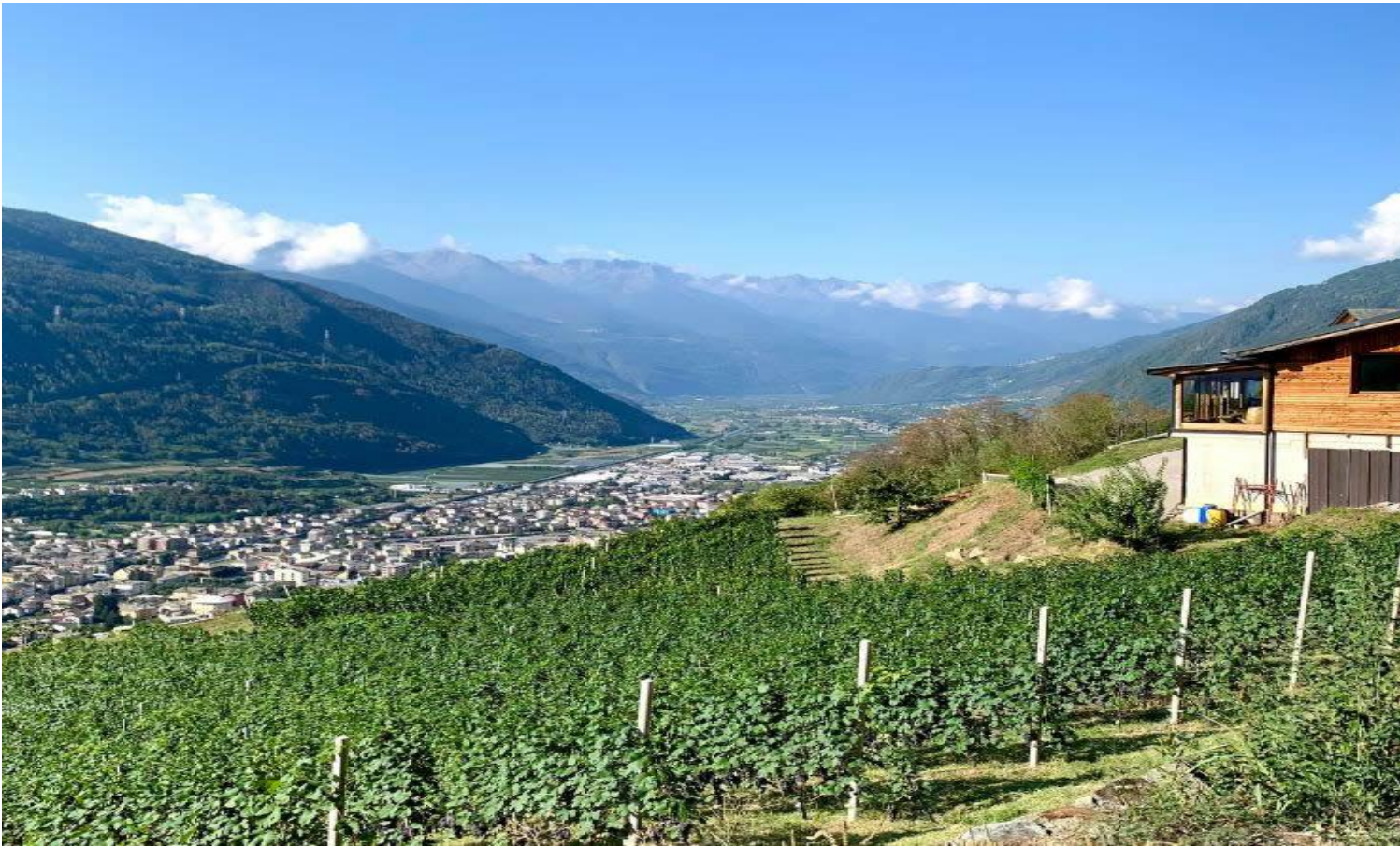
La cantina Ca' Bianche a Torano.

parte a vite, con piante che sfiorano i cent'anni d'età.