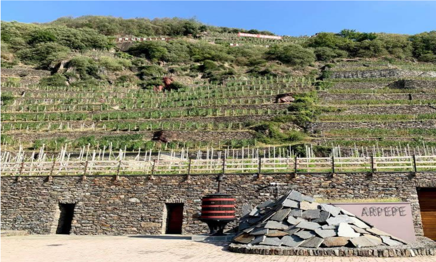
L'esterno della cantina Arpepe, fondata nel 1984.