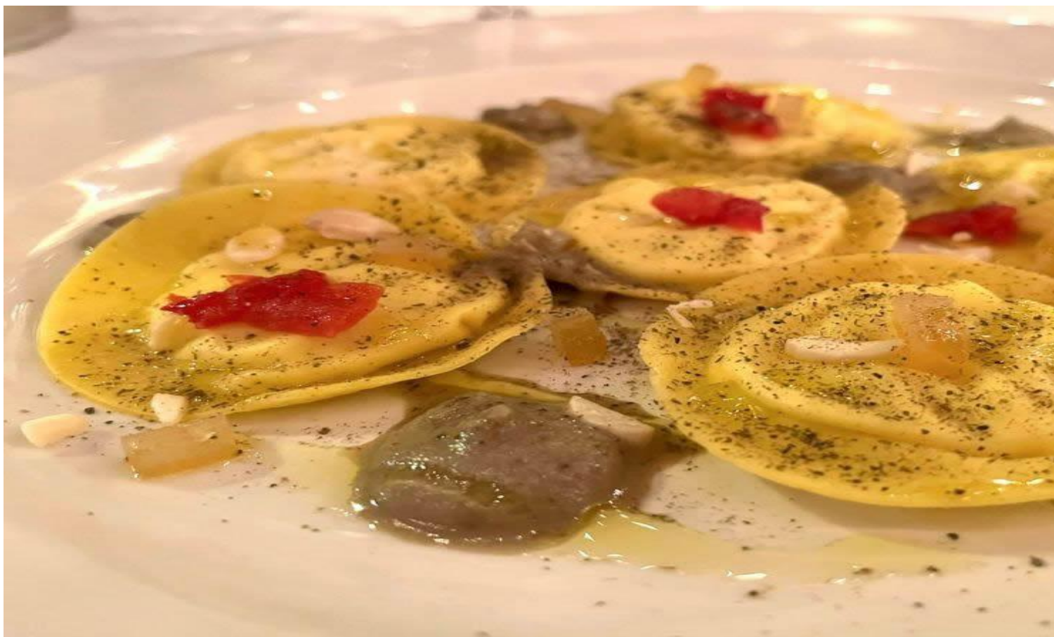
Tortelli caprino, mandorle, capperi, pomodori confit e limone candito (Foto © Kevin Feragotto).