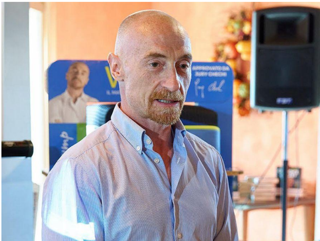
Jury Chechi.