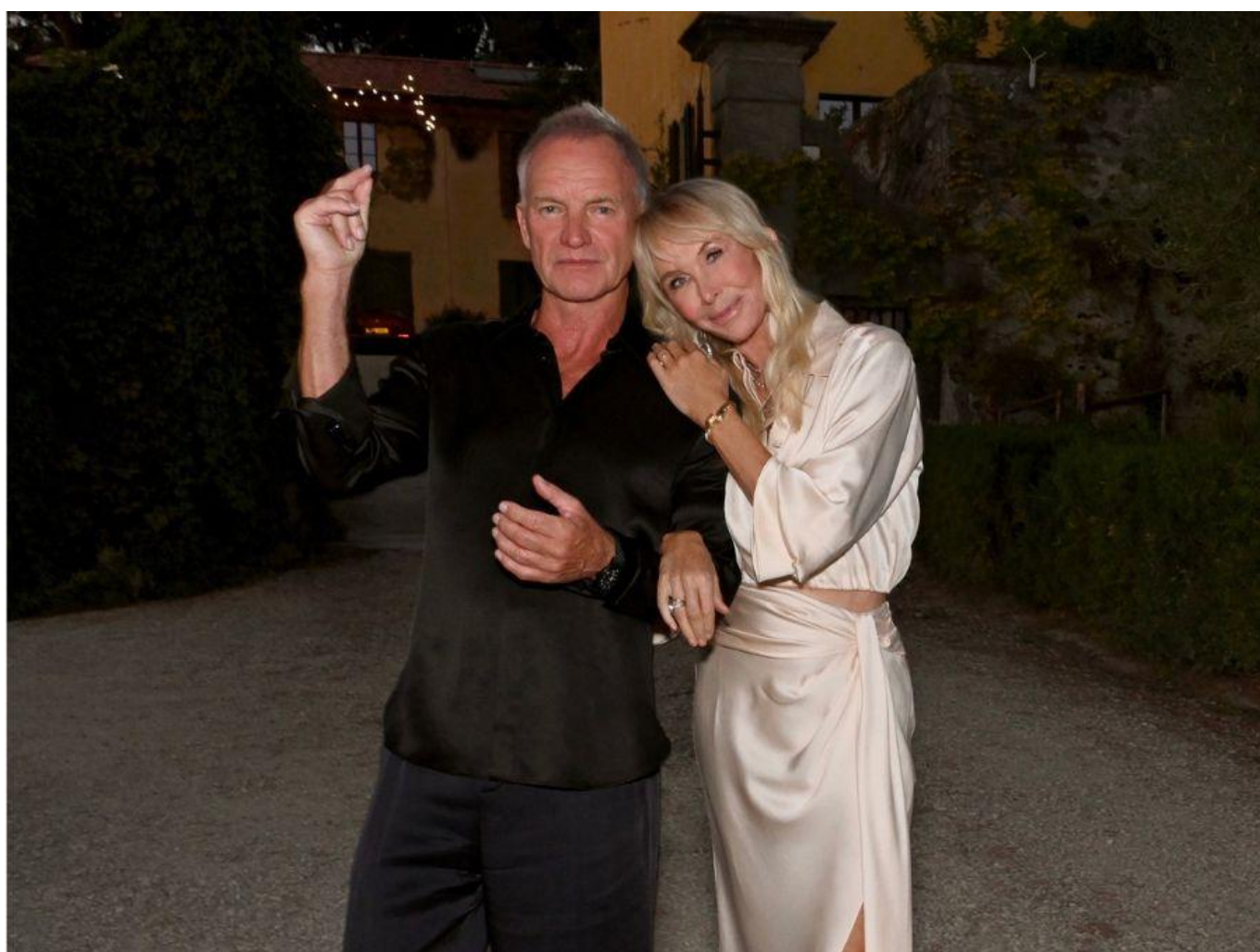
Sting e Trudie Styler, titolari di Tenuta Il Palagio.

È stato uno dei primi personaggi celebri a dedicarsi alla viticoltura. Nel 1997, Sting e sua moglie Trudie Styler hanno acquistato " Tenuta Il Palagio " a Figline Valdarno (FI), già di proprietà del marchese di San Clemente. I vini del cantante, prodotti tra le dolci colline toscane, sono molto amati dal pubblico per la qualità e per le curatissime etichette dedicate alle canzoni più famose dell'artista e dei Police. Tra queste, " Sister Moon " (blend di Sangiovese, Merlot e Cabernt), " When We Dance " (Sangiovese), " Roxanne " (nelle due versioni, bianco Vermentino e rosso con uve Merlot, Sangiovese e Syrah) e " Message in a Bottle ", (rosso con uve Sangiovese, Merlot e Syrah e bianco con uve Vermentino). Info: www.il-palagio.com