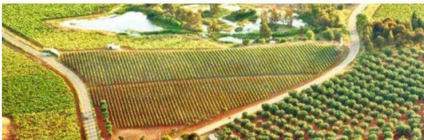
Al Bano e la sua tenuta.

Una linea non poteva non essere dedicata al padre: il “Don Carmelo” , infatti, è uno dei vini più amati dal cantante e prodotto in bianco (Chardonnay), rosato (Negroamaro) e rosso (uve nere autoctone). Anche le altre etichette rievocano affetti familiari e canzoni: “Nostalgia” (Negroamaro), “Romina” (Negroamaro vinificato in rosato), “Felicità” (Sauvignon/Chardonnay), “Basiliano” (Negroamaro), “Bacchus” , “Platone” e “Mediterraneo” (Negroamaro vinificato in rosato). Info: www.vinicolalbano.com