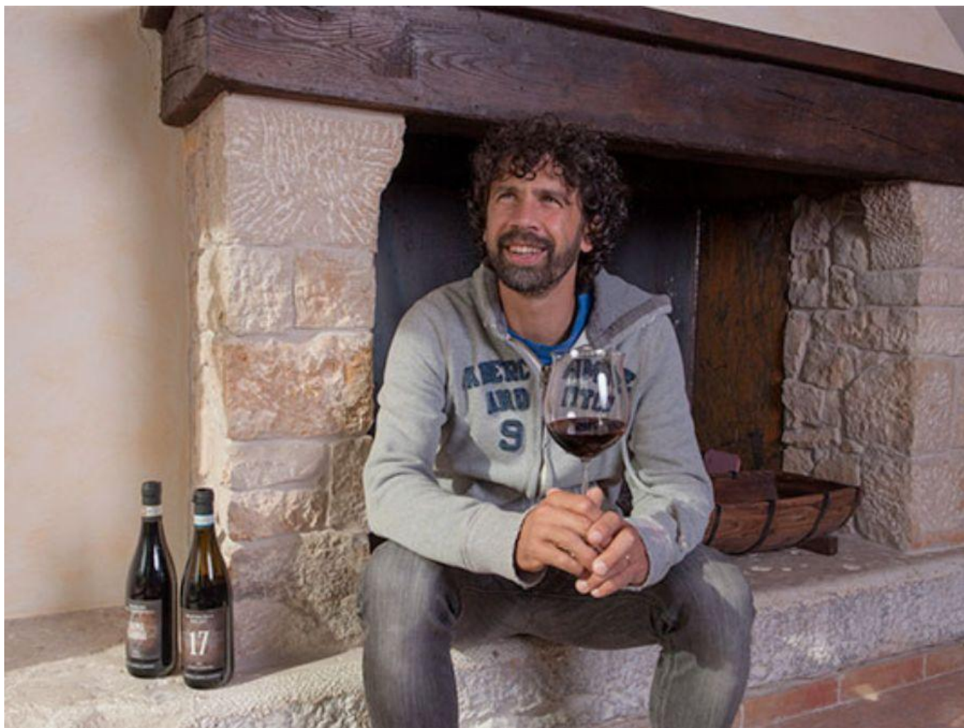
Damiano Tommasi.